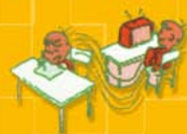
Pasa de una actividad a otra

LA DETECCIÓN PRECOZ ES IMPORTANTE PARA EL BUEN DESARROLLO DE LA AUTOESTIMA Y RELACIONES SOCIALES Y EVITAR POSIBLES PROBLEMAS DE CONDUCTA Y DE RENDIMIENTO ESCOLAR.