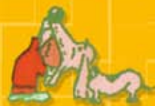
Se enfrasca en actividades peligrosas