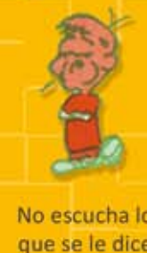
No escucha lo que se le dice