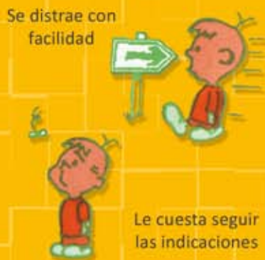
Se distrae con facilidad