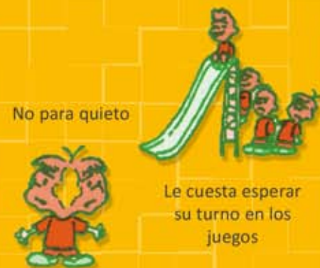
No para quieto