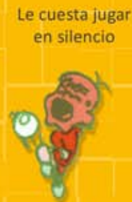
Le cuesta jugar en silencio